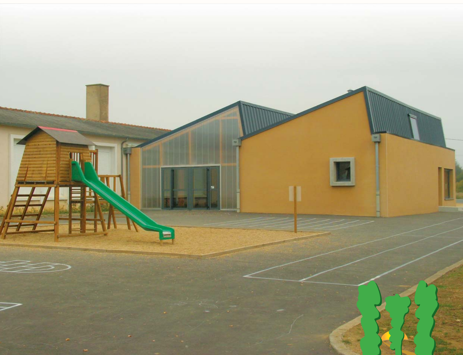
École Primaire René BUSSON