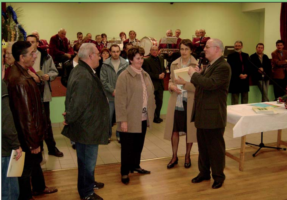
Accueil des nouveaux habitants 2007