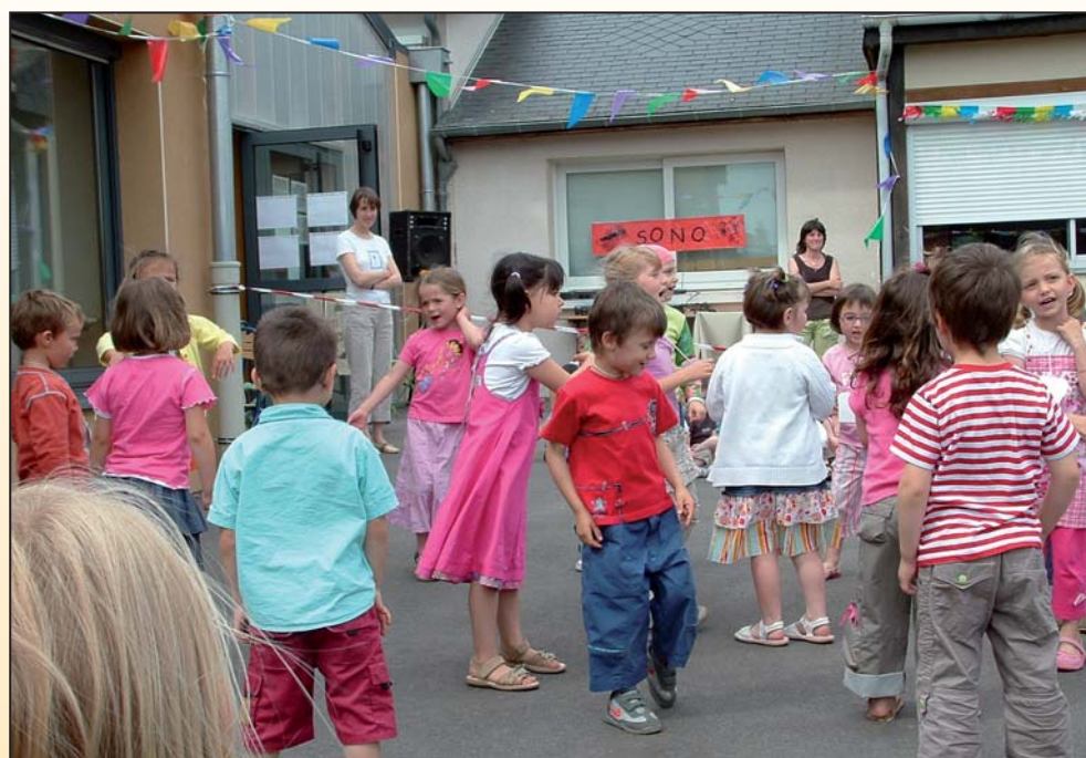
Kermesse de l'École