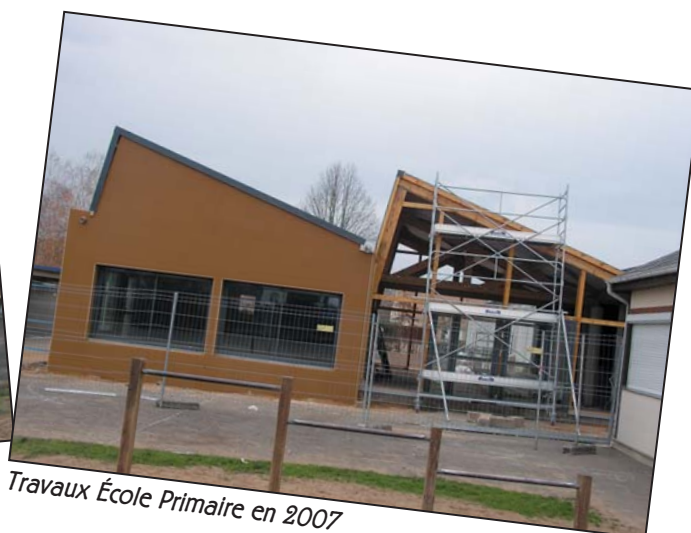
Travaux École Primaire en 2007