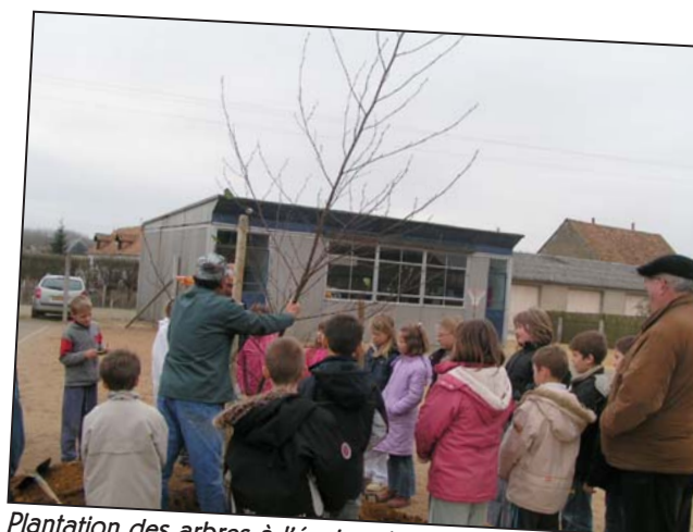
Plantation des arbres à l'école primaire René Busson