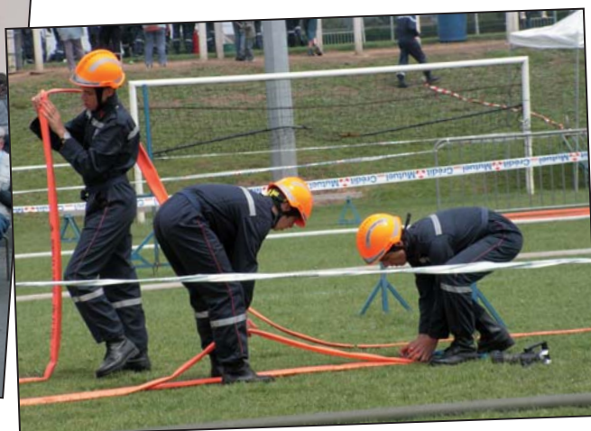
Participation des JSP Mézeray-Malicorne au concours départemental à Brûlon, le 24 juin 2007