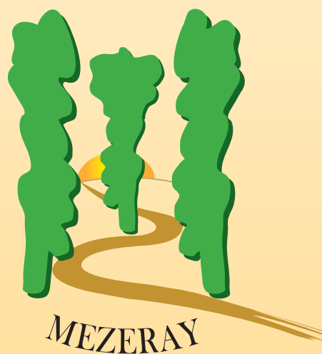
Exposition Familles Rurales