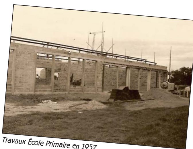
Travaux École Primaire en 1957