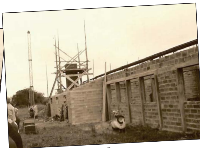
Travaux École Primaire en 1957