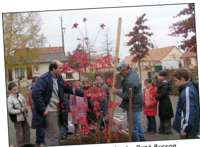
Plantation des arbres à l'école primaire René Busson