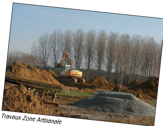
Travaux Zone Artisanale