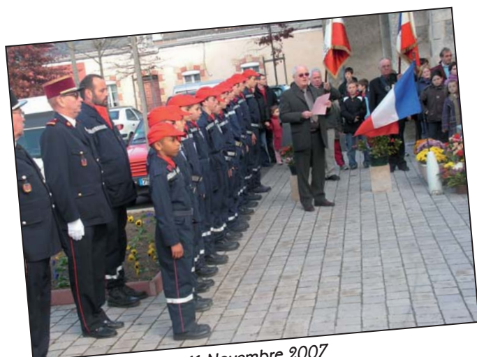
Commémoration du 11 Novembre 2007