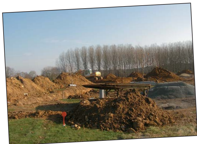
Travaux Zone Artisanale