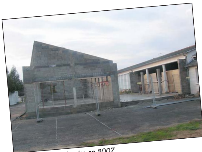
Travaux École Primaire en 2007