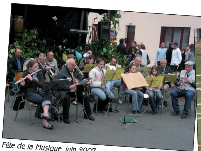
Fête de la Musique, juin 2007