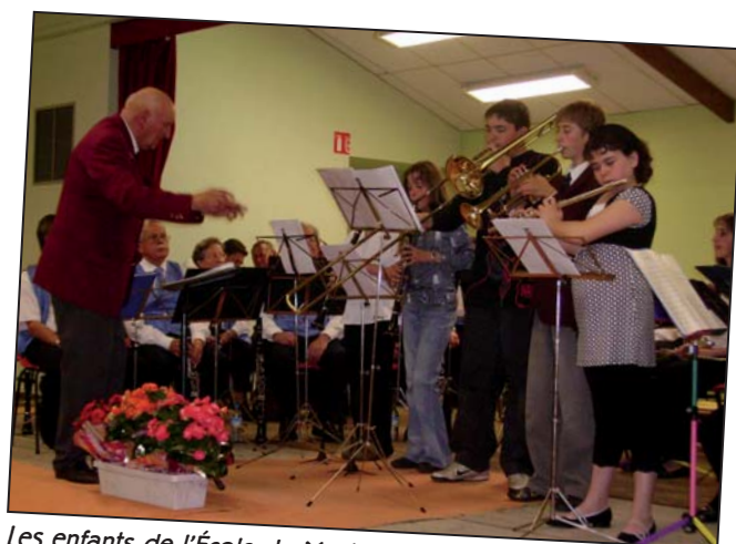
Les enfants de l'École de Musique